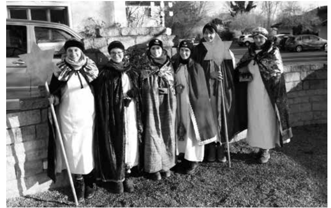
Der Dirndlverein bedankt sich bei allen Spendern.