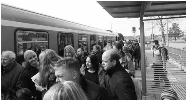
Bahnhof Forsting: Die Großgruppe beim Einsteigen

Die Nachfrage zur diesjährigen Zirkusfahrt mit dem MVV vom Bahnhof Forsting war besonders groß, aber es gab nur 140 Eintrittskarten für den Zirkus, deshalb organisierten die Freien Wähler Forsting noch eine zweite Bahnfahrt zum Circus Krone nach München. Diese zweite Bahnfahrt, zu der sich bereits wieder 65 Teilnehmer angemeldet hatten, musste leider wegen dem Coronavirus kurzfristig abgesagt werden.