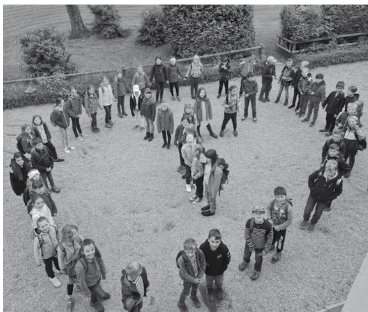
Das Foto zeigt die Erstkommunionkinder vor der Abfahrt nach Oberreith.

Die Albachinger Kinder feierten ihre Erstkommunion am 15. Mai. Wieder in der Kirche und mit feierlicher musikalischer Gestaltung war es jeweils ein wunderschönes Erlebnis für die Kinder.