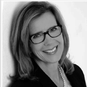
MARTINA WESSELING IMMOBILIEN

Elke Posch, Hilgen 109, 83539 Pfaffing, 0178-3896980, www.stoffstueberl.de , info@stoffstueberl.de