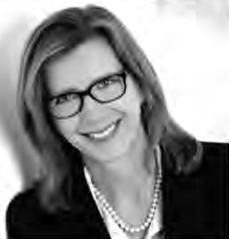
MARTINA WESSELING IMMOBILIEN

Zur Teilnahme am Festgottesdienst um 9 Uhr mit Prozession sind alle Gläubigen, besonders auch die Erstkommunionkinder (im Kommuniongewand, jedoch ohne Kerze), die Vertreter der kommunalen und kirchlichen Gremien sowie die Vereine mit ihren Fahnenabordnungen herzlich eingeladen.