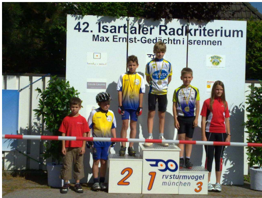
Alle Teilnehmer bei der Siegerehrung