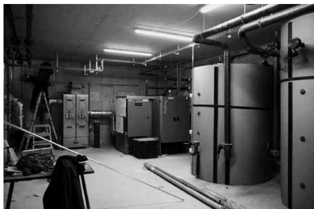
Der Heizkessel und die Pufferspeicher rechts daneben. Ganz links befindet sich die Abgasreinigung.