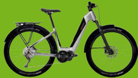
BESV TRX Urban , Tiefeinsteiger, Shimano Deore 12-Gang

Wir beraten Sie gerne, am Besten vereinbaren Sie einen Termin und wir nehmen uns Zeit für Sie.