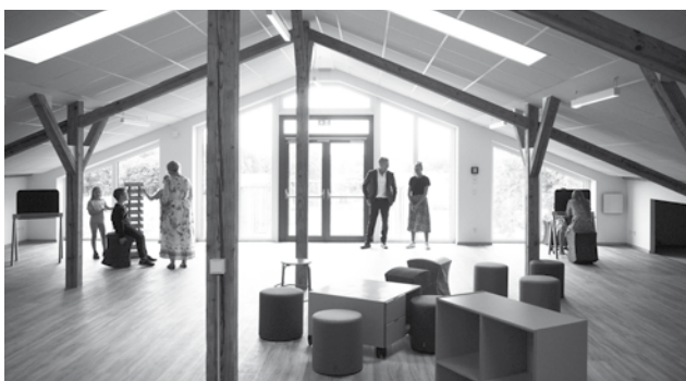
Der Multifunktionsraum wird von Kindern und Erwachsenen angeschaut.

Das Dachgeschoss der Pfaffinger Grundschule ist ausgebaut.